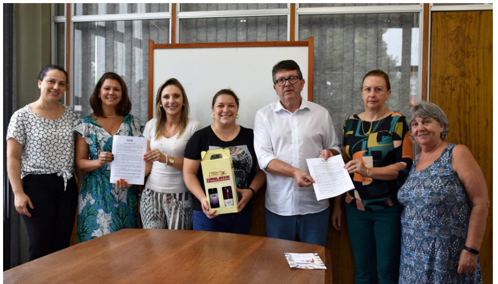
Instituições de Veranópolis vão receber um montante de R$ 175.072,00