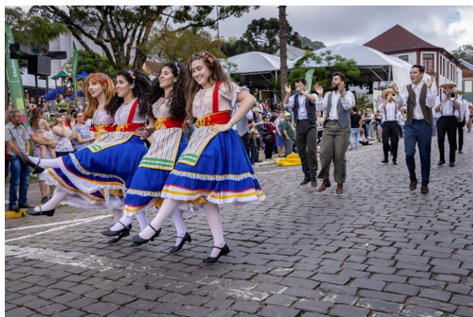
Festas tradicionais da região, como a Fenamassa, em Antônio Prado, foi uma das que recebeu apoio da CERAN em 2019

Dos seis projetos e ações aprovados pelo município de Flores da Cunha, destaque para o Floresporte, iniciativa que deverá impulsionar o esporte na cidade. A CERAN repassou um montante de R$ 111.200,00, via Lei do Esporte, para a contratação de profissionais que vão dar