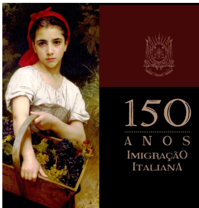
Projeto “150 Anos da Imigração Italiana no Rio Grande do Sul” prevê a publicação de três volumes

As histórias relatadas nos livros abrangem mais de 4 milhões de descendentes italianos do Rio Grande do Sul, cuja trajetória começou em 1875, com a chegada das famílias Crippa, Radaelli e Sperafico na cidade de Farroupilha.