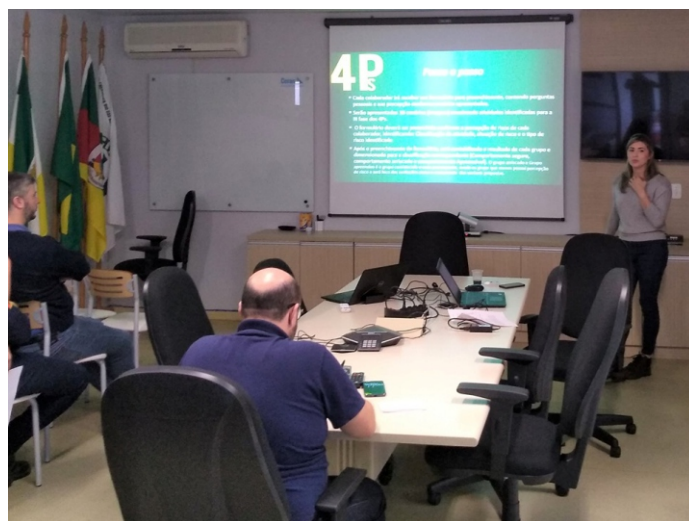
"Percepção de Riscos" destacou fatores relevantes como uma equipe comprometida com a própria segurança

A apresentação do tema faz parte da terceira fase do Programa 4Ps (Pare, Pense,