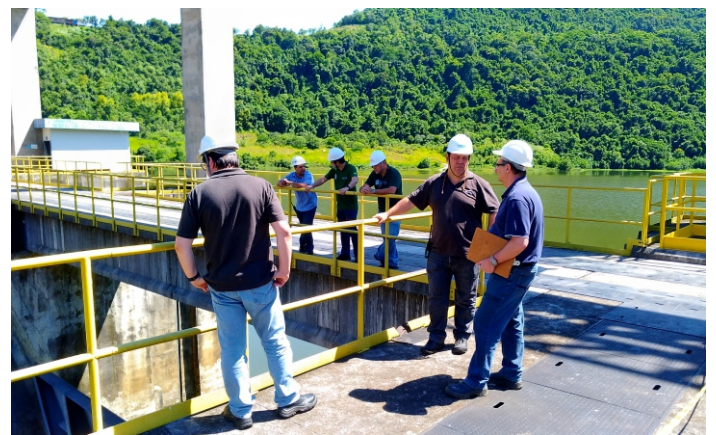
Fiscalização nas barragens da CERAN não identificou qualquer irregularidade que possa afetar a segurança

A inspeção das barragens faz parte de uma força-tarefa capitaneada pela ANEEL, que nessa primeira ação, entre os dias 12 e 22 de fevereiro, fiscalizou as barragens de 21 hidrelétricas. Até o mês de maio, a previsão é fiscalizar as barragens de 142 hidrelétricas em 18 estados brasileiros. Após essa primeira etapa, a ANEEL continuará a inspeção presencial e pretende alcançar, até o mês de dezembro, um total de 335 barragens.