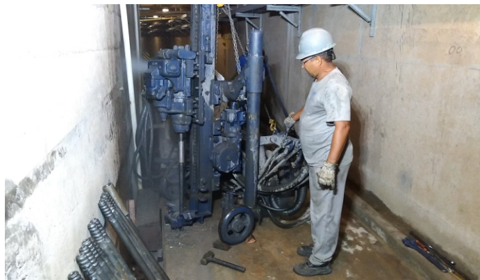
Usina Hidrelétrica 14 de Julho fez a limpeza e a reperfuração dos drenos drenagem da Barragem e do Vertedouro